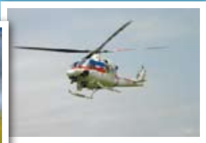
国土交通省 防災ヘリコプター「ほくりく号」