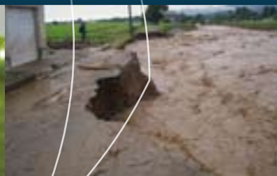
小矢部川水系山田川 (H20.7.28)