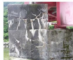
下部工にASRIによる劣化が疑われる