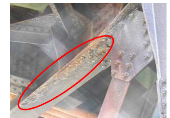
耐候性鋼材に層状の剥離