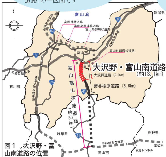
図1 大沢野・富山南道路の位置