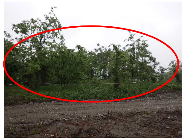
区画③⑫ A=600m 2