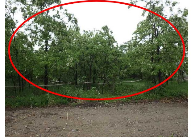
区画③⑩ A=600m 2