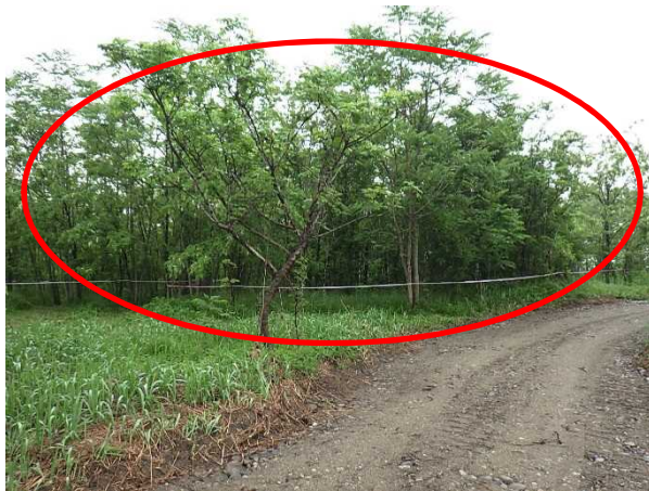
区画③⑪ A=600m 2