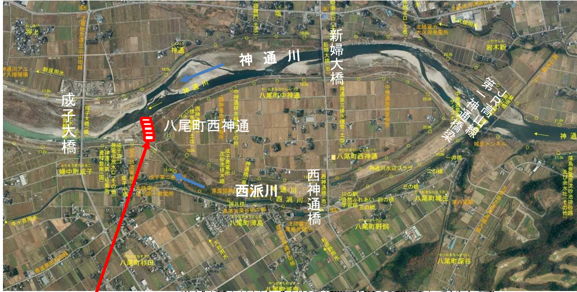
図4 神通川 ⑳～㉓