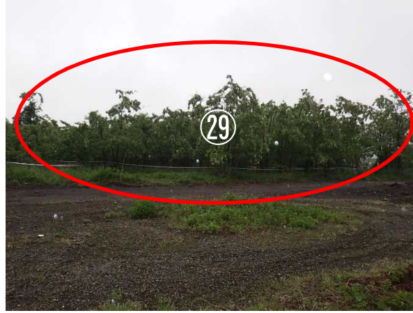
区画②⑨ A=600m 2