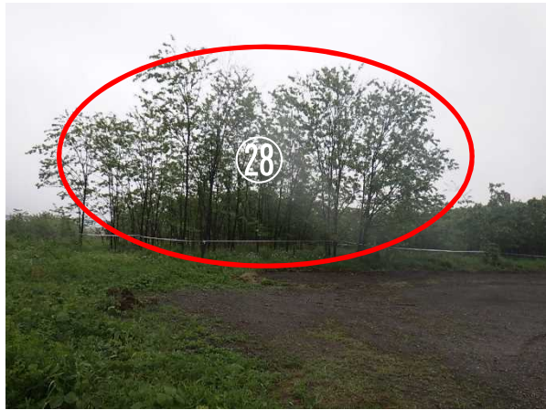
区画②⑧ A=600m 2