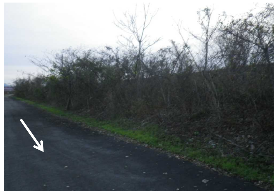
⑯(左岸14.4k) A=1200m 2