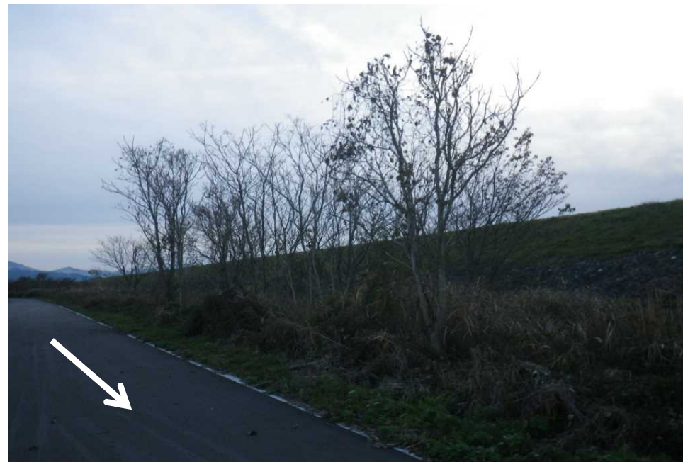
⑭(左岸14.2k) A=500m 2