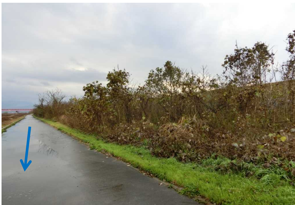
⑮(左岸14.4k) A=1200m 2