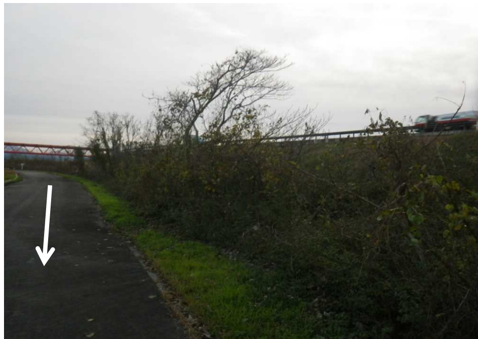
⑱ (左岸14.6k) A=1200\text{m}^2