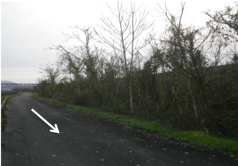
⑰ (左岸14.6k) A=1200\text{m}^2