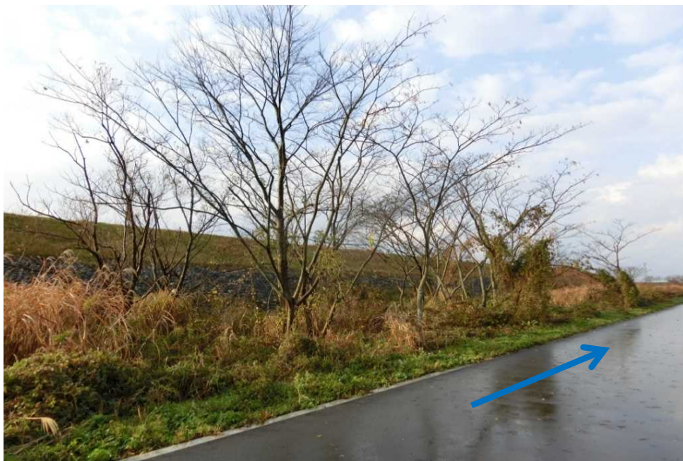
⑬(左岸14.2k) A=500m 2