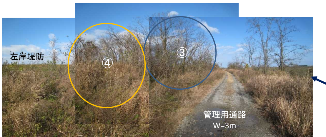
管理用通路上流側より下流方向を望む