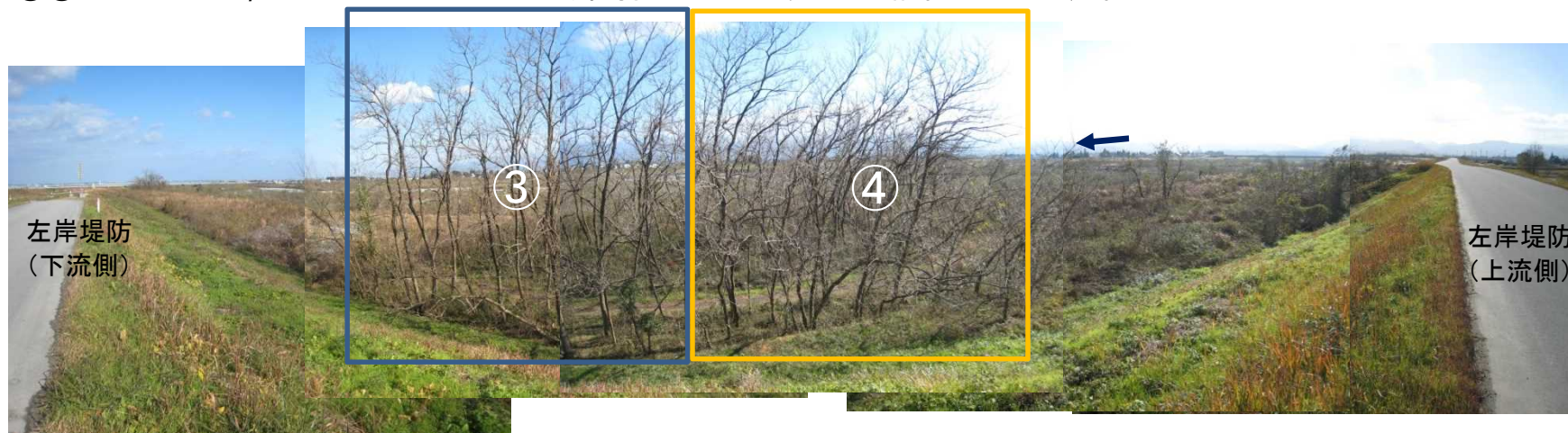
左岸堤防から対象箇所を望む

③④(左岸11.7k) φ 10~30cmハリエンジュ、伐採範囲 A=1,000m 2 (幅約40m×延長約25m)×2箇所