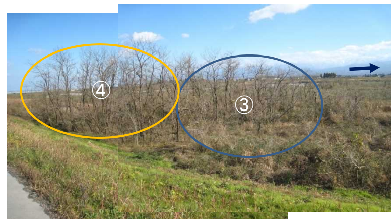
左岸堤防11.8km付近から下流方向を望む