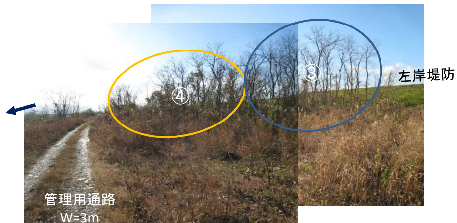
管理用通路下流側より上流方向を望む