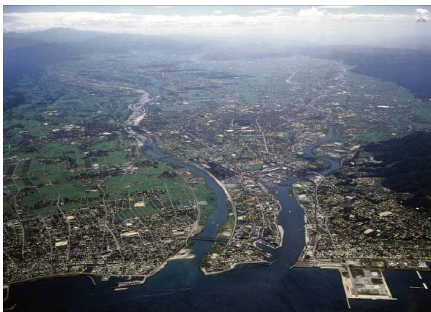
庄川を下流より望む

「人々の暮らしと産業に恩恵をもたらし、地域の歴史、文化を育んできた庄川との関わりを再認識し、新たな治水の歴史を刻むとともに“アユ跳ねる庄川”を次世代に継承していく」