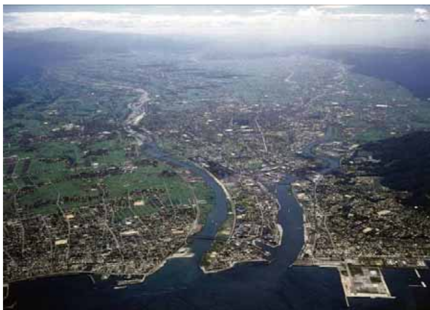
庄川を下流より望む

「人々の暮らしと産業に恩恵をもたらし、地域の歴史、文化を育んできた庄川との関わりを再認識し、新たな治水の歴史を刻むとともに“アユ跳ねる庄川”を次世代に継承していく」