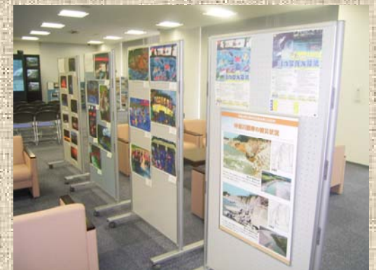
富山河川国道事務所