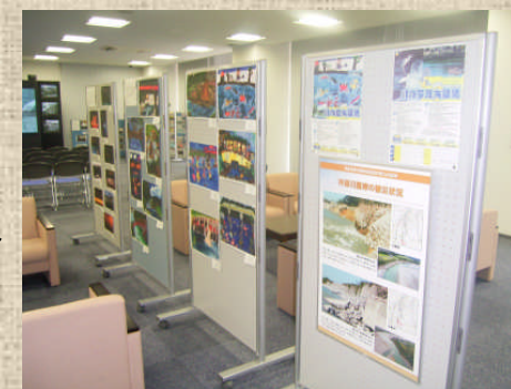
富山河川国道事務所