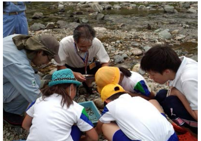
＜ 平成 27 年 7 月に利賀川で実施した「水生生物調査」の様子 ＞