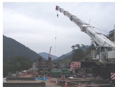
豆谷橋梁見学箇所 (H27.9.24 撮影)