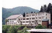
集合場所 ございしょ利賀

「ございしょ利賀」は当事務所の工事監督業務のほか、情報発信基地として、旧利賀小学校を活用し整備した監督員詰所です。