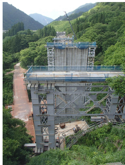
豆谷橋梁見学箇所 (H27.7.2 撮影)