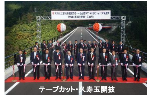
テープカット・久寿玉開披