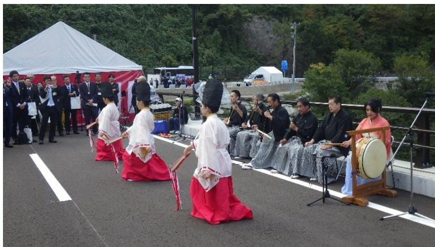
長麦屋(むぎや節保存会)