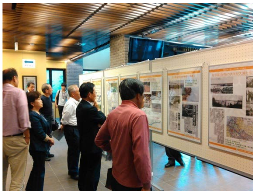
休憩時には多くの方々にご覧いただきました

今後も多くの方々に利賀ダム事業についてお知らせし、理解いただけるよう様々なイベント等で情報発信していきます。