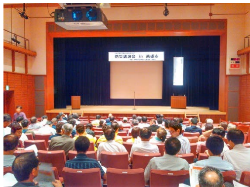
講演会には多くの方々が来られました