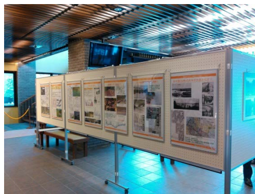
展示パネルは講演会場入口前に設置