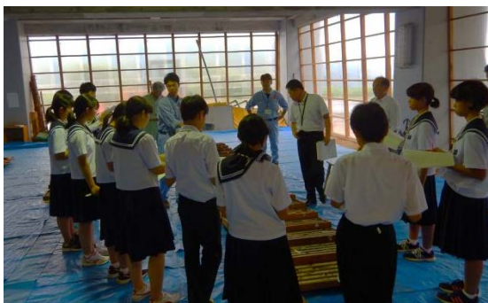
コアの採取方法や見方を説明。