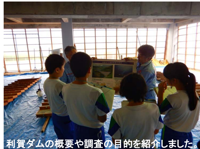
利賀ダムの概要や調査の目的を紹介しました。

地質の科目は苦手意識を抱いてしまいがちですが、今回の授業を通して、少しでも地質への理解を深めてもらえたら嬉しいです。