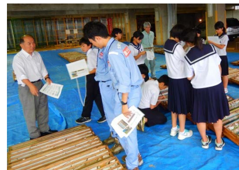
授業で習った岩などもちらほら。