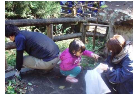
▲草やゴミを取ってきれいに!