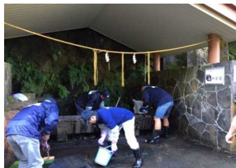
▲みんなで水汲み場をピカピカに!