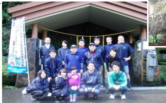
▲今回参加した利賀ダムボランティア隊のメンバー