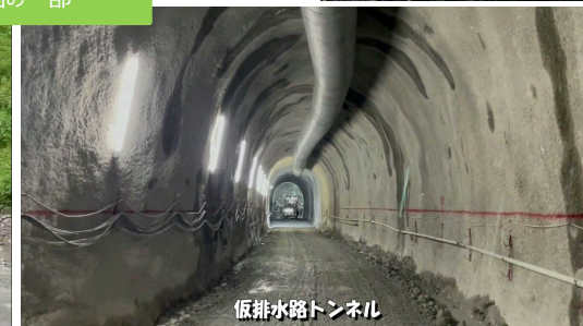
仮排水路トンネル