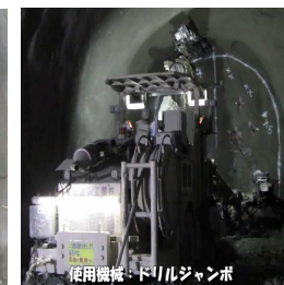
使用機械：ドリルジャンボ