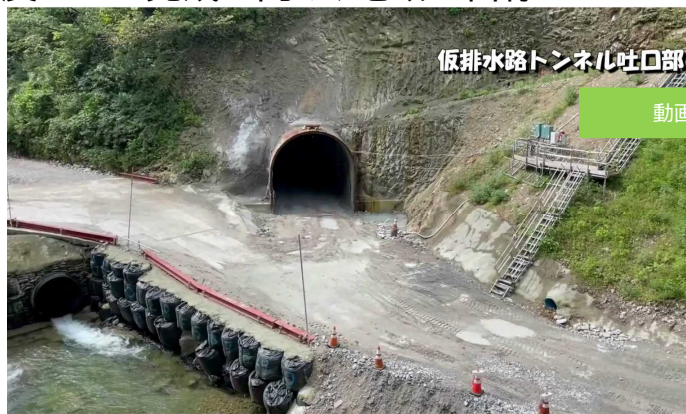
仮排水路トンネル吐口部