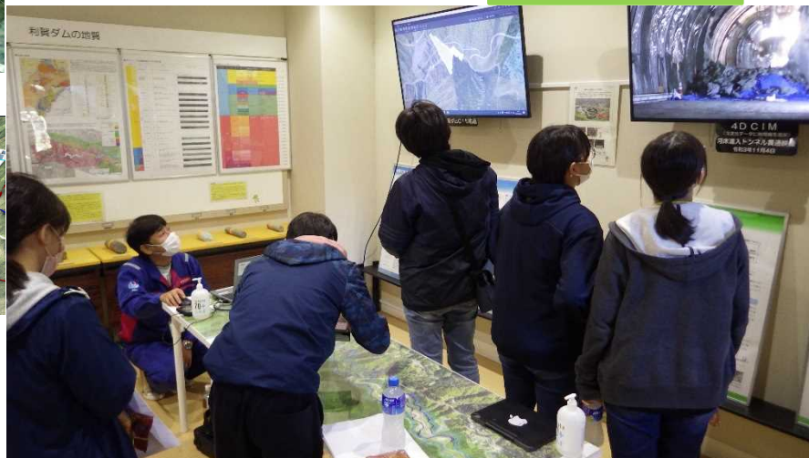
DXルーム見学の様子

DXルームでCIMモデルによる利賀ダム事業建設概要を説明しました！ 参加者の皆様にとって、利賀ダム建設事業に関して一層ご理解を深めていただく良い機会となりました。