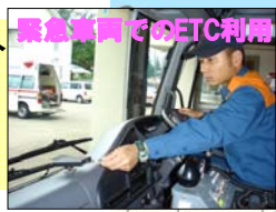
例: 妙高高原スキー場から新潟県立中央病院までの救急搬送時間の変化