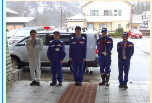
第2班帰還(1月21日 立山砂防事務所)