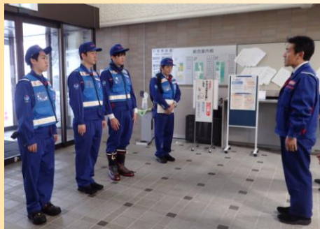
第2班出動(1月15日 立山砂防事務所)