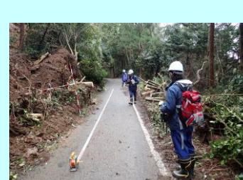
斜面崩壊、道路の損傷状況(里町地区)