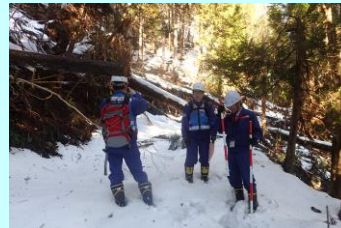
斜面の崩壊状況(熊野地区)