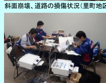
調書の作成(石川県庁)