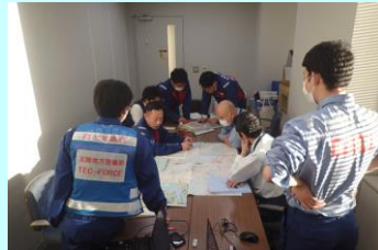
事前打ち合わせ(石川県庁)