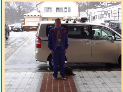
第3班出動(1月21日 立山砂防事務所)