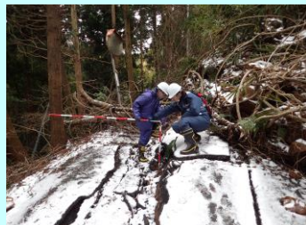
斜面崩壊、道路の損傷状況(尊利地区)