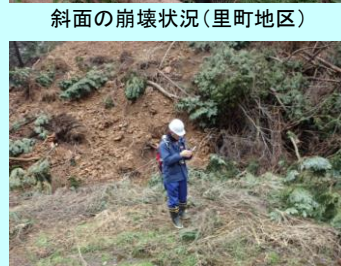
斜面の崩壊状況(上谷地区)