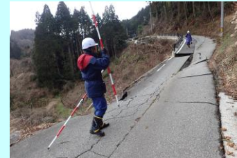
道路の損傷状況(中小田屋地区)