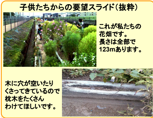
質問タイムでは、たくさんの質問が出ました

土砂災害はどこで発生しやすい？ 枕木は購入するといくら？ 砂防堰堤は全国にどれくらいある？