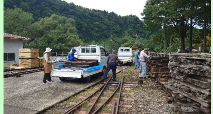
使用済み枕木(無償提供)の積込みの様子