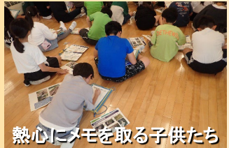
熱心にメモを取る子供たち