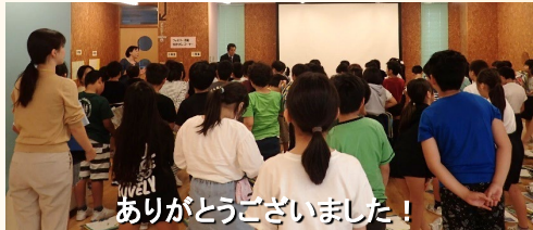
ありがとうございました！

枕木の無償提供について（10月下旬～11月上旬） 立山砂防事務所では、今回の小学校への提供以外にも使用済みの枕木を一般の方に無償で提供しています。枕木の処分にお金がかかることや、環境への影響に配慮したもので、花壇等に利用していただくことで環境改善の効果を期待した取り組みです。使用済み枕木は本数に限りがありますので、事前に申し込みが必要となります。また、枕木を積める車両で集積場まで取りに来ていただける方に限ります。詳しくは立山砂防事務所のホームページ http://www.hrr.ml.it.go.jp/tateyama/ でご確認をお願いいたします。