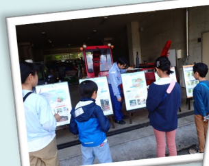
なるほど！ 早めの避難が 肝心だね！