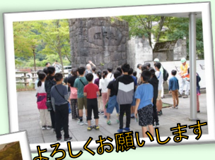
よろしくお願いします！