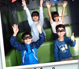
ドキドキ！ ワクワク！