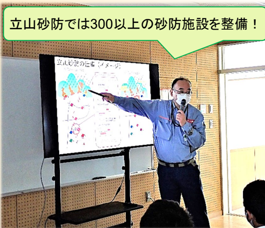
立山砂防では300以上の砂防施設を整備！

開催日 : 令和5年6月30日(金) 時間帯 : 9:25~10:10 場所 : 富山市立太田小学校 参加者 : 5年生(31名)・教員(3名)