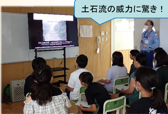
土石流の威力に驚き！