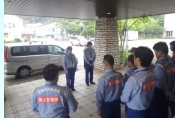
出発式の様子(立山砂防事務所 7月12日)

この調査結果は、今後の復旧・復興作業を円滑に進め、地域の方々に一日も早く日常生活を取り戻していただくための基礎資料となります。