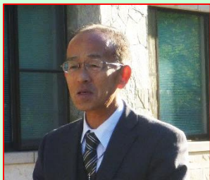
目澤副所長(事務)ご挨拶