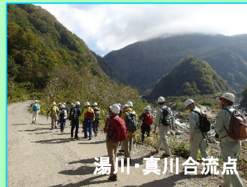
湯川・真川合流点