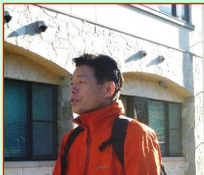
舟橋支部長(立山町長)ご挨拶