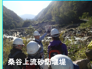
桑谷上流砂防堰堤