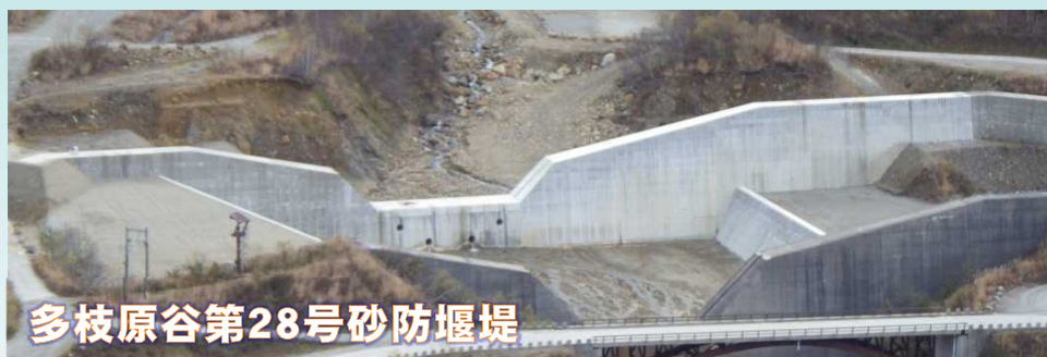
多枝原谷第28号砂防堰堤