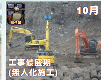
10月 工事最盛期 (無人化施工)