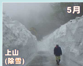
5月 上山 (除雪)