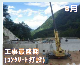
8月 工事最盛期 (コンクリート打設)