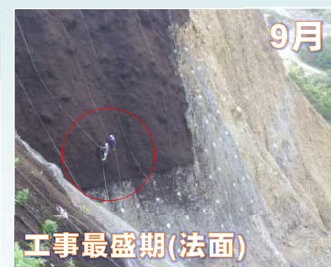
9月 工事最盛期(法面)