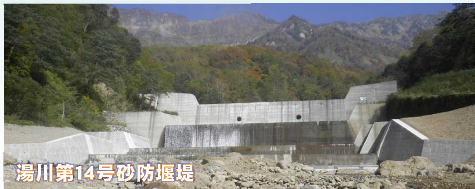
湯川第14号砂防堰堤