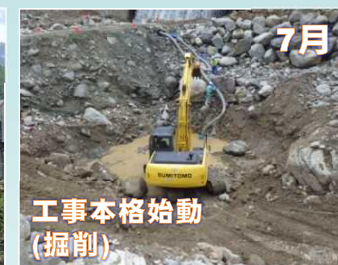
7月 工事本格始動 (掘削)