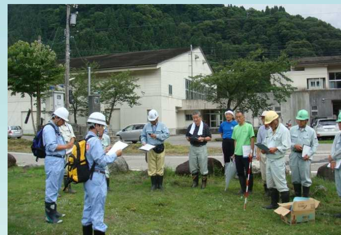
参加者(17名)による点検前のミーティング

ゴールデンウィーク前の4月15日(火)の点検に引き続き、夏休み前の点検を7月9日(水)に行いました。常願寺川水辺の楽校(本宮砂防堰堤周辺)、立山1号公園(藤橋左岸たもと)、千寿ヶ原緑地公園の3箇所を、富山市、立山町、人・川ふれあい連絡会(小見小学校、地元自治会等)と協力して行いました。改善する必要がある箇所については、速やかに補修や応急対策を講じます。