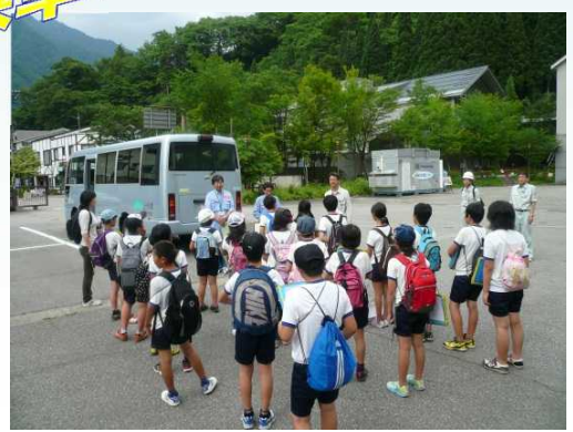
最後にスタッフへのお礼