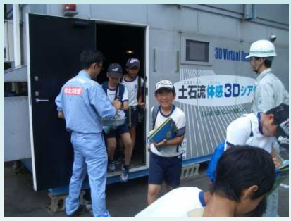
土石流体感装置も体験！！