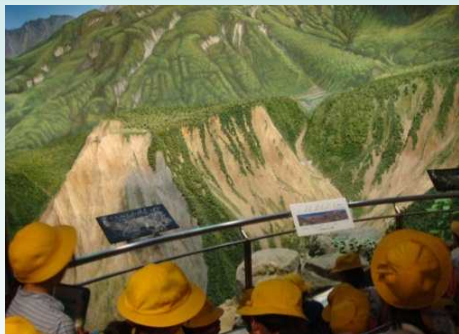
立山カルデラのジオラマを見学