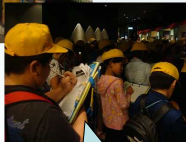
必死に メモを取る 小学生達！