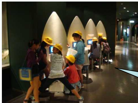
防災シミュレーション ゲームに夢中