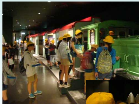
トロッコ実車 見学