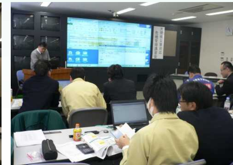
講演会に先駆けて実施した危機管理演習