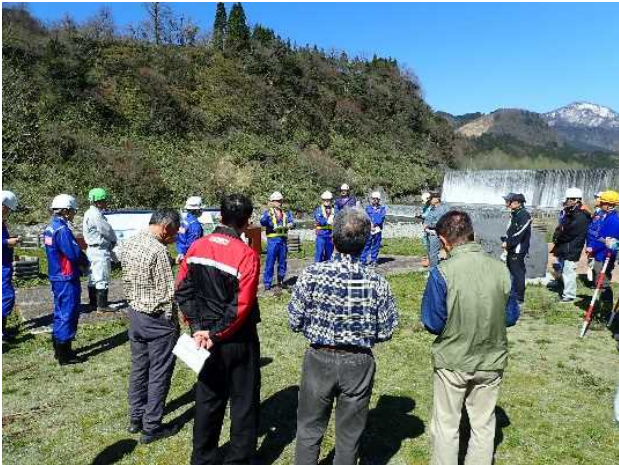
参加者35名での点検前の行程確認 (常願寺川水辺の楽校)