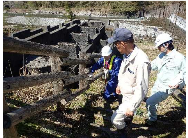
安全利用点検を行う参加者 (常願寺川水辺の楽校)