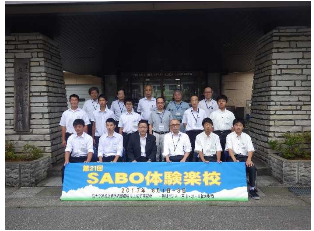
開校式後の記念撮影