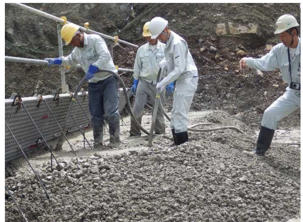
砂防堰堤のコンクリート打設