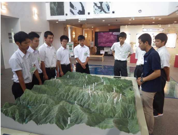
立山カルデラ砂防博物館見学