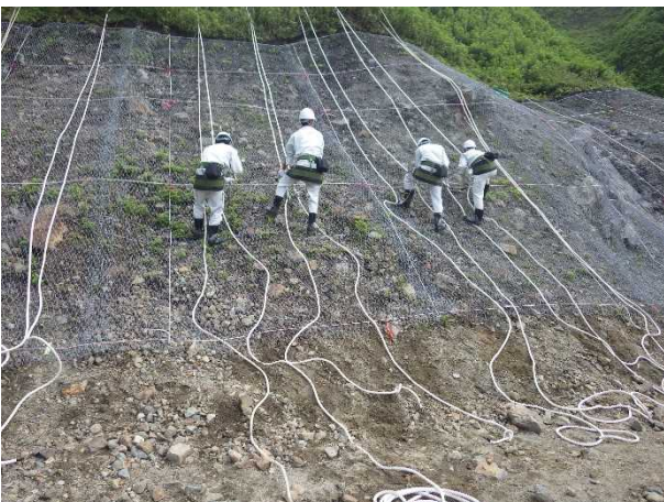
山腹工でのロープ作業