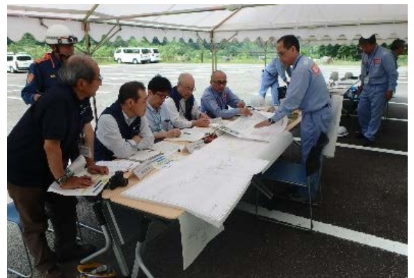
事故対策本部情報伝達（現地）