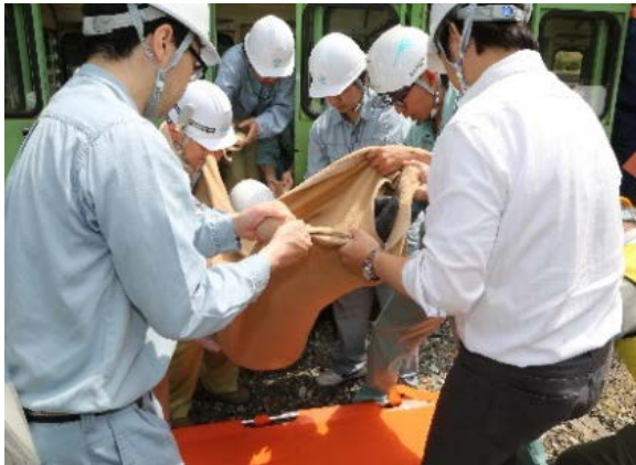
重傷者の応急手当、搬出（現地）