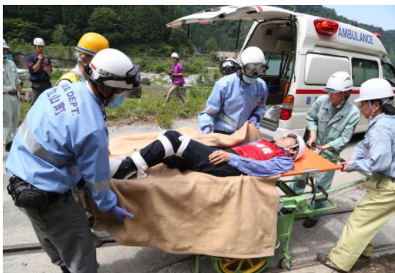
救急車による搬送（現地）