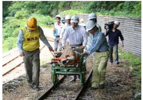
レスキューカートによる搬送（現地）