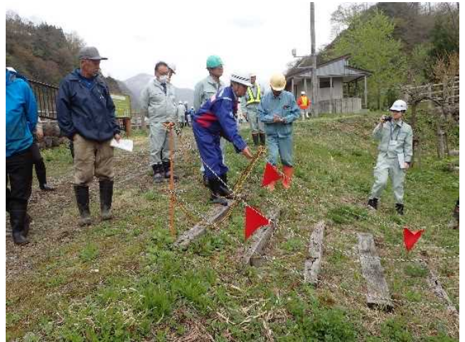
安全利用点検を行う参加者 (常願寺川水辺の楽校)