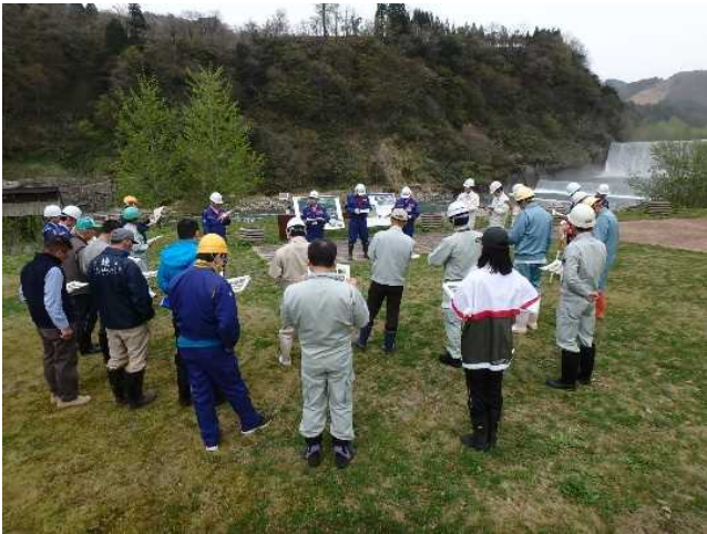
参加者31名での点検前の行程確認 (常願寺川水辺の楽校)