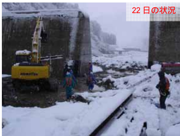
スリット部での作業状況