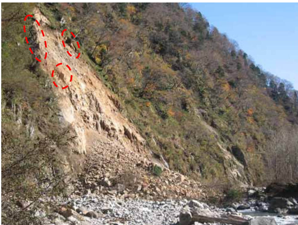
今後崩壊する危険が高い箇所