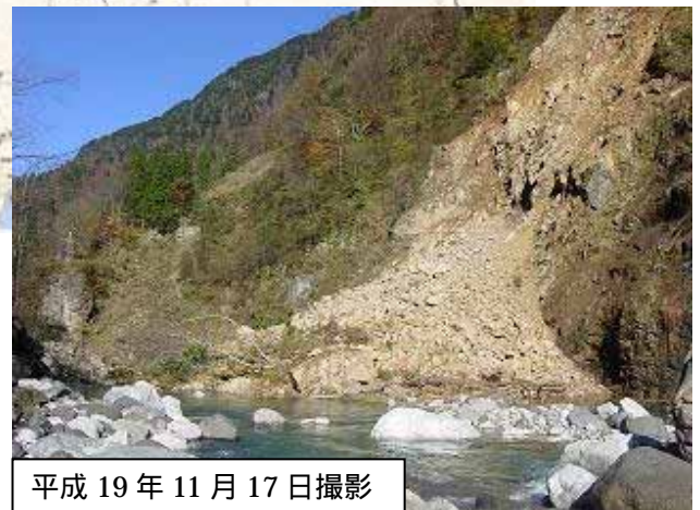
写真 - 2 崩落土砂の堆積状況