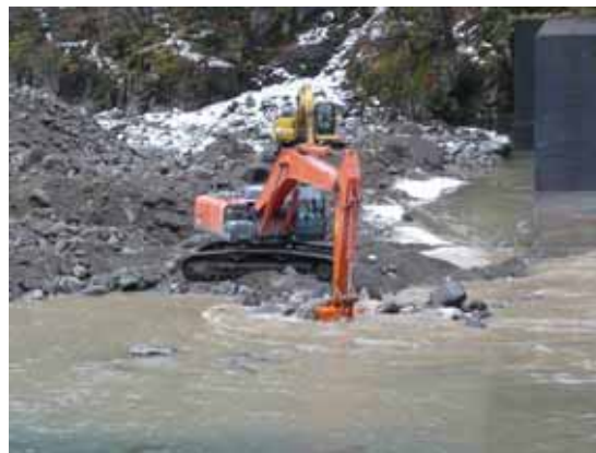
掘削を進める建設機械