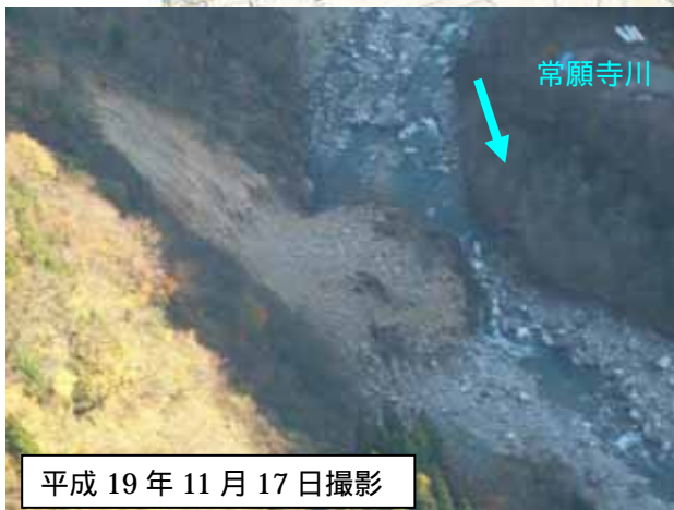
写真 - 1 崩落土砂の堆積状況