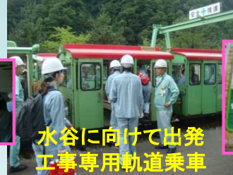
水谷に向けて出発 工事専用軌道乗車