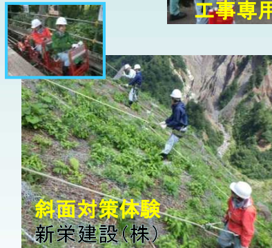
斜面对策体験 新栄建設(株)