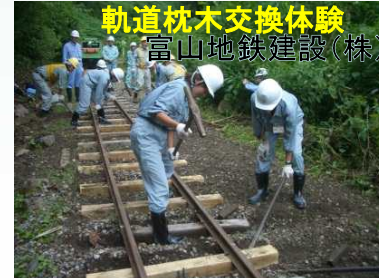
参加された大学生の皆さん 大変お疲れ様でした。