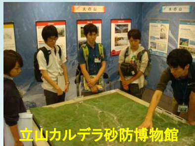
立山カルデラ砂防博物館