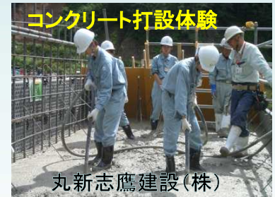
コンクリート打設体験