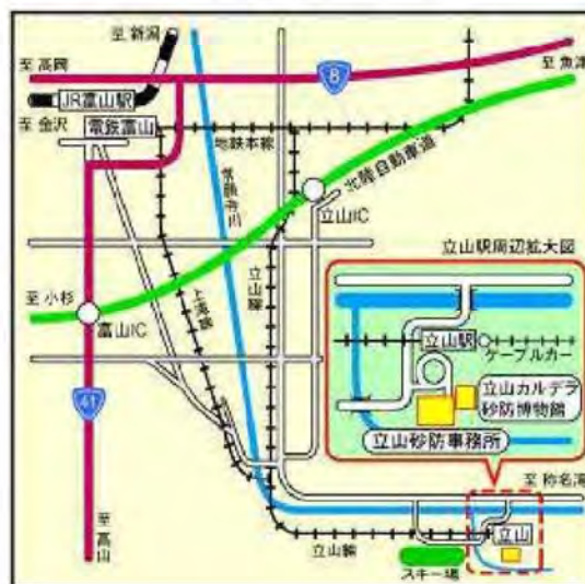
立山砂防工事事務所位置図