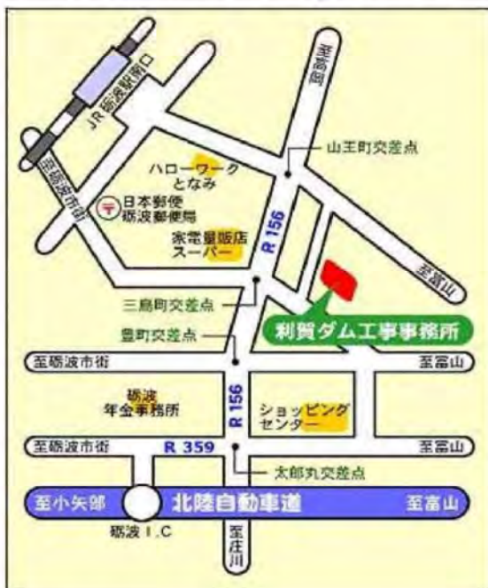
利賀ダム工事事務所位置図