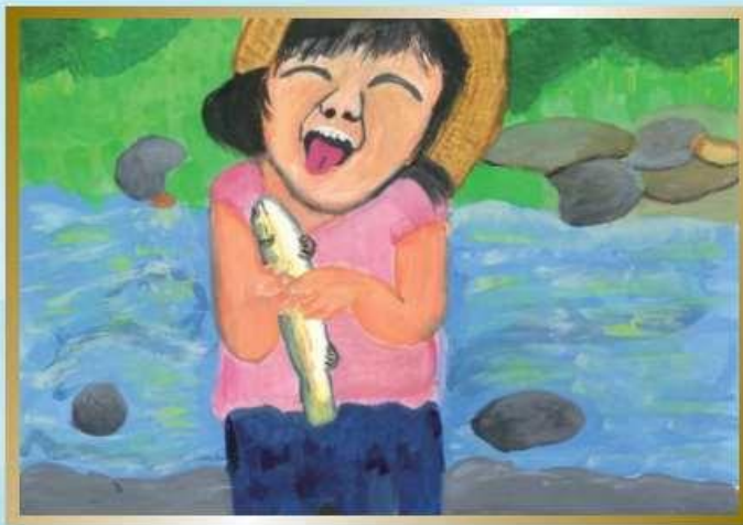
平成28年度 金賞作品

★同時開催★ 本宮砂防堰堤80周年特別企画 常願寺川 水辺の楽校 絵画コンクール