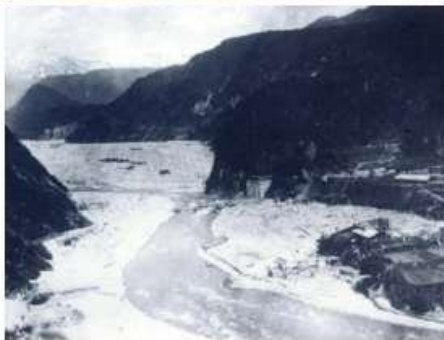
着工当時の様子（昭和10年）