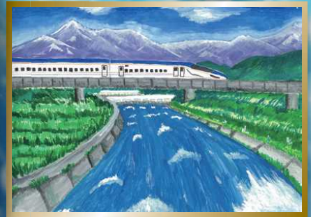
平成27年度 金賞作品

【開催趣旨】 「河川愛護月間」に併せて実施するもので、小学生の川に対する関心を深めるとともに、多くの人々に小学生の描いた川の絵をとおして郷土の川の将来について考えてもらう機会を設けるものです。