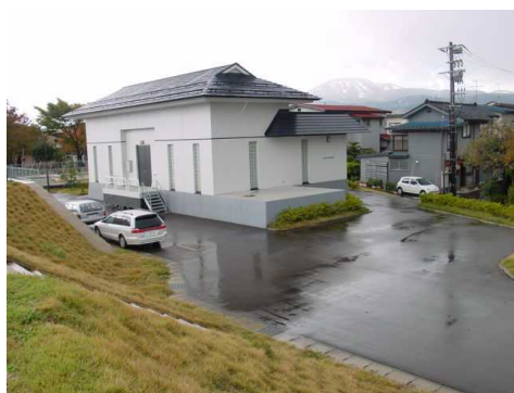
【上越消流雪揚水機場】