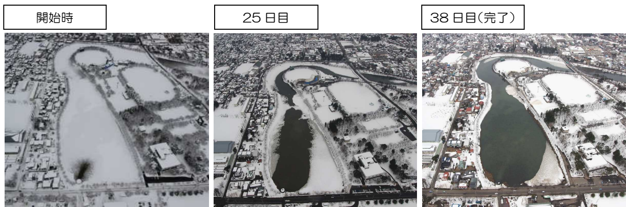
【平成24年冬期の設備稼働状況】

・また、一斉雪下ろしの場所に近接していることから、 運搬距離が短くなり排雪効率が向 上し、生活道路の早期開通や市街地の渋滞等の緩和など、 冬期の生活環境の改善を図りま す。