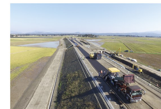
鶴町I.C.付近 舗装工事状況 (H30.12撮影)