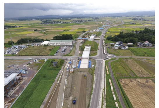
戸野古新田から鶴町I.C.を望む (H30.9撮影)