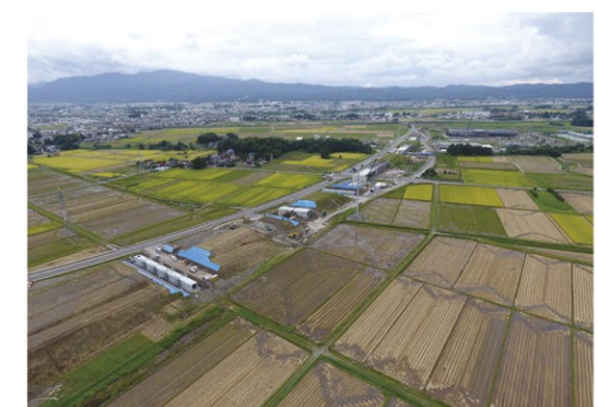
本道付近 改良工事状況 (H30.9撮影)