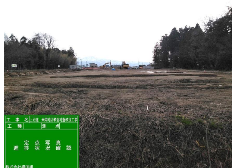
【安塚側より高田方向を望む】