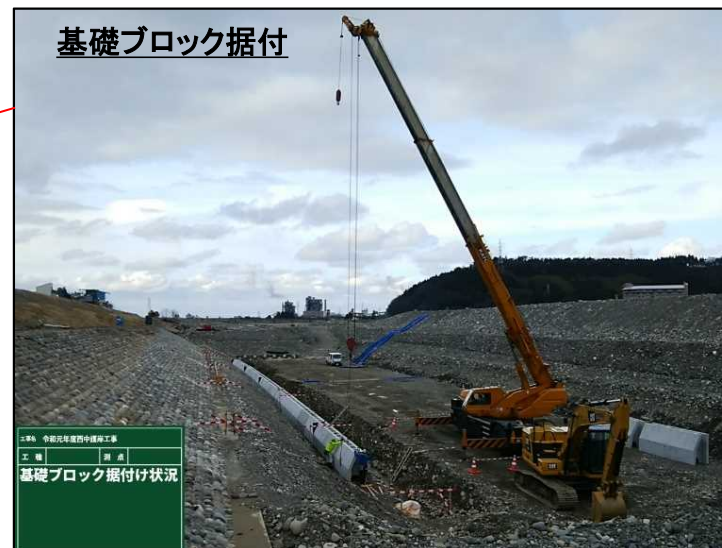
基礎ブロック据付