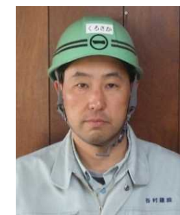
株式会社 谷村建設

2月より、練石張工（約700m 2 ）のスタートとなります。寒さが厳しくなると予想されますので品質の確保や体調管理をしっかりと行っていききたいと思います。