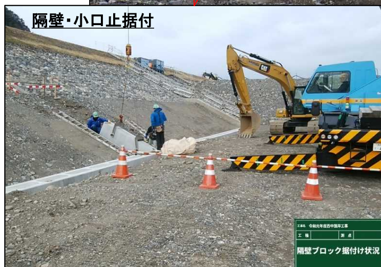
隔壁・小口止据付