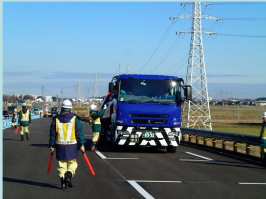
H27.12.9 チェーン装着啓発活動実施状況