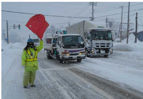
写真：大型車の立ち往生と交通規制の状況 じょうえつし なかごうく いなりやま 上越市中郷区稻荷山地先(H26.1.22)