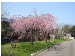
美しい魅力ある風景の形成 (新潟県糸魚川市)