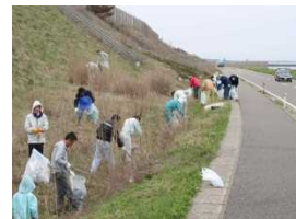
道路清掃活動 (新潟県村上市)