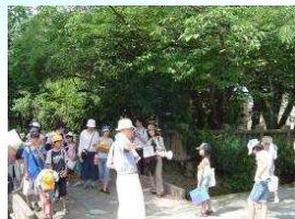
小学生への歴史文化の伝承 (石川県金沢市)