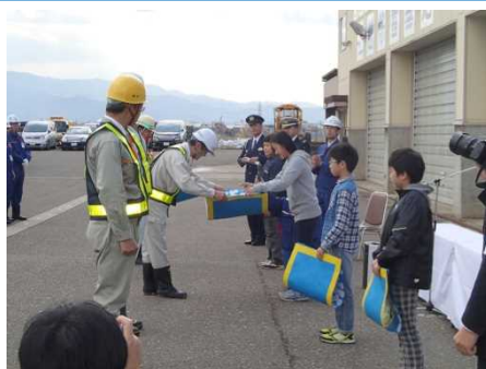
小学生から業者さんへの激励