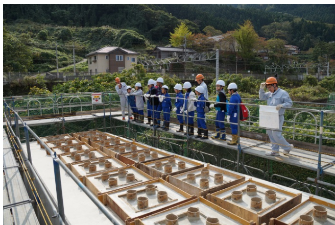
施工中の橋台の見学