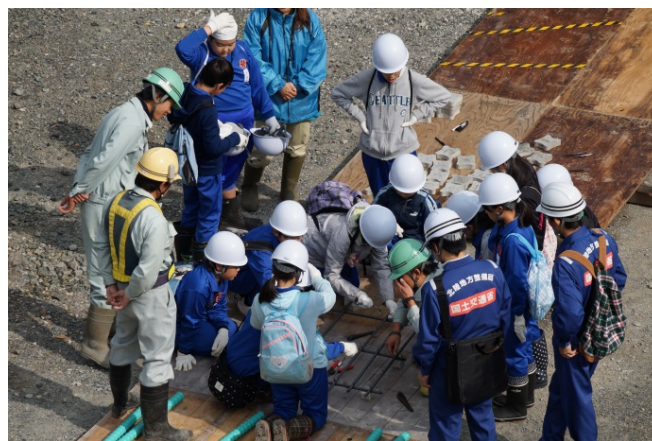
鉄筋結束の作業体験