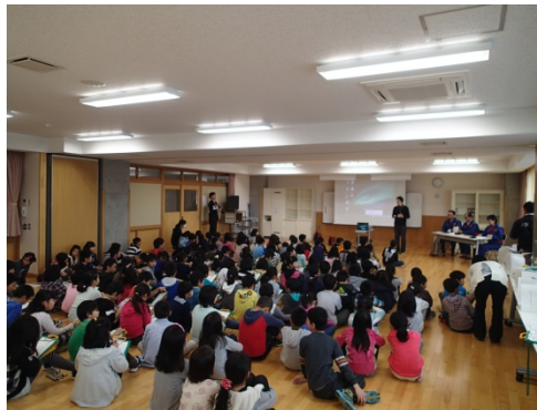
平成27年度実施状況