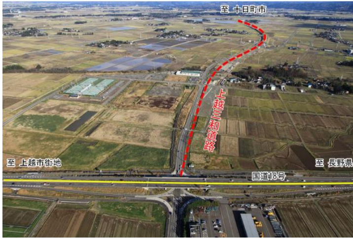
上越市寺付近から十日町市方面を望む

上越三和道路は、上越魚沼地域振興快速道路の一部を構成する地域高規格道路であり、冬期を含めた安全性・信頼性を確保し、高規格幹線道路との連携により広域的な交流を促進し、地域の活性化に大きく寄与することを目的とした、上越市寺から同市三和区本郷に至る約7.0kmの事業です。