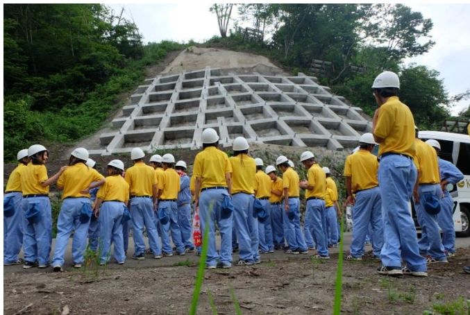
昨年度の実施状況(国道18号 妙高大橋架替事業 工事現場)